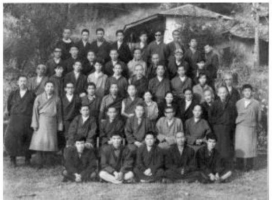
Primer grup de buròcrates tibetans que van realitzar el treball de reconstrucció a l'exili

L'Administració Central tibetana (coneguda com CTA) es va establir amb la finalitat de proporcionar una administració apropiada per a la comunitat de refugiats i principalment, guiar la lluita tibetana per la llibertat, la seu se situa a Dharamsala, 500 km al nord de Nova Delhi a l'estat indi de Himachal Pradesh. Durant tots aquests anys, la CTA ha estat i és, el lloc de trobada on els refugiats, espiritualment desarrelats però amb una ferma determinació poden reconstruir la seva vida i el seu futur. Els tibetans dins i fora del Tibet reconeixen a la CTA com el seu únic i legítim govern.