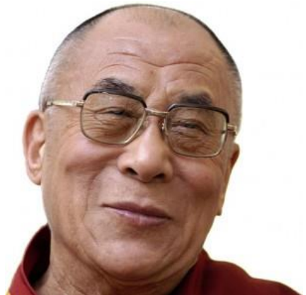
S.S. el Dalai Lama

Sus esfuerzos por lograr una solución pacífica al conflicto sino-tibetano se vieron frustrados por la cruel política de Beijing en el este de Tíbet, la cual provocó un levantamiento popular. Este movimiento de resistencia se extendió hacia otras partes del país, y el 10 de marzo de 1959, la capital de Tíbet, Lhasa, explotó con la mayor manifestación de toda la historia de Tíbet, llamando a China a abandonar el Tíbet y reafirmando la independencia de éste. Su Santidad escapó hacia India donde le fue dado asilo político; alrededor de 80.000 refugiados tibetanos siguieron a Su Santidad hacia el exilio.