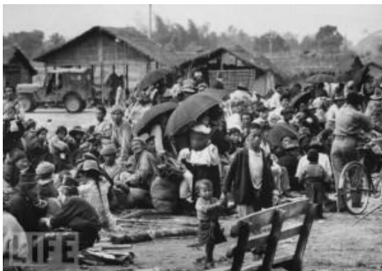
Un grupo de refugiados tibetanos en Assam, al noreste de la India, en 1959

En un principio, dos grandes campamentos fueron establecidos con la asesoría del Gobierno de India: uno en Missamari, localizado a 10 millas de Tezpur en el estado indio de Arunachal Pradesh; el otro en Buxa Duar, antiguo campo de prisioneros de guerra inglés situado cerca de la frontera con Bután en Bengala. Pocas semanas después de habilitar los campamentos 6.000 refugiados llegaron a Missamari y 1.000 a Buxa Duar.